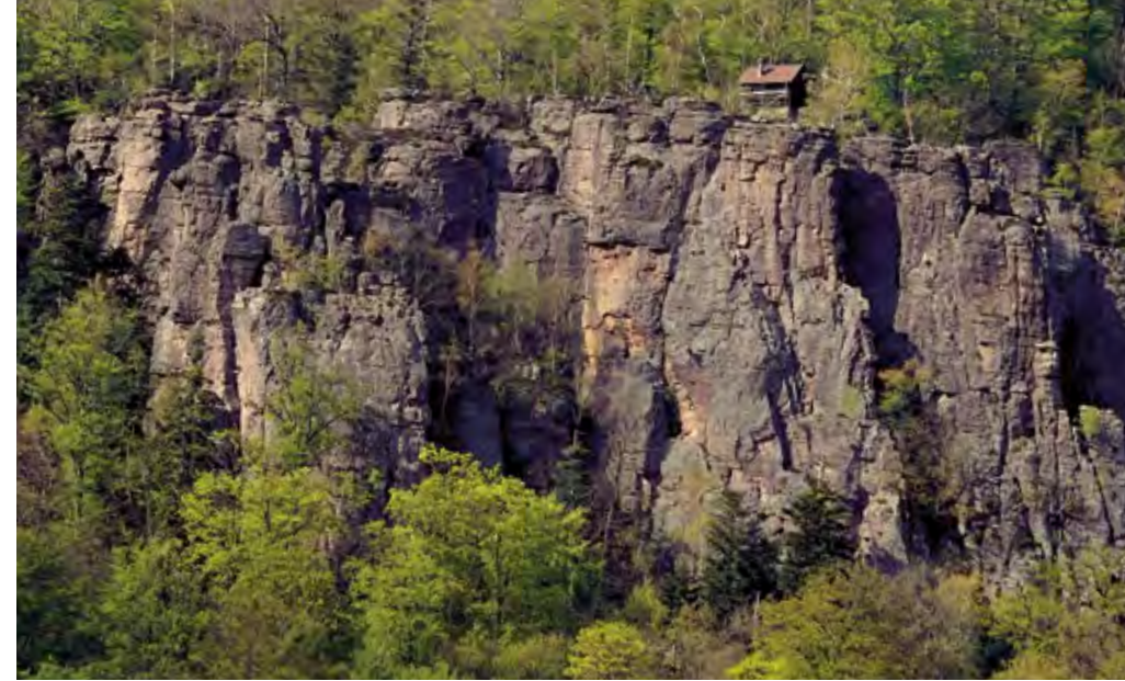
Die Falkenwand mit der Bergwachthütte oben drauf.