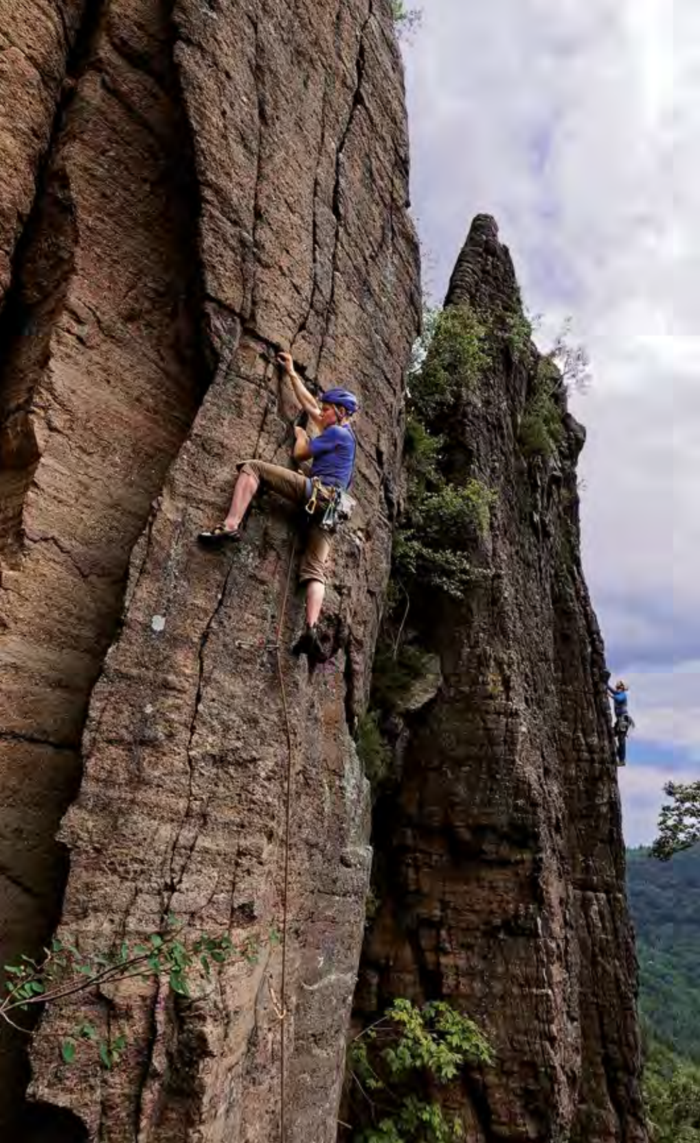
Zwei mit einem Klick: Links Vagabundenweg (7+), rechts Offenburger Weg (4+)