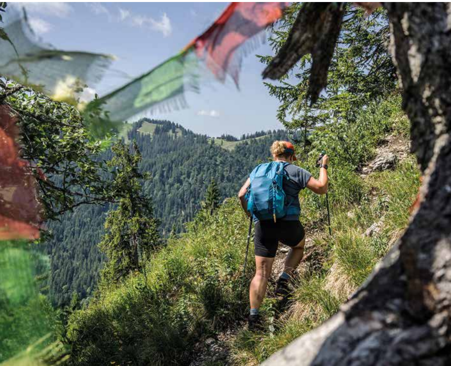
Ein Hauch von Himalaya umweht die Begeher des Ostgrats an der Brecherspitz.

Ausgangspunkt Schliersee, Parkplatz am Spitzingsattel, 1.140m Höhenmeter 560 Wegnummer 637, 625 Charakter Bis zur Oberen Firstalm verläuft der Weg bequem über die Rodelstrecke. Der Westgrat zur Brecherspitz ist anfangs etwas felsig, aber seilversichert. Zeitaufwand 1 1/2 Std.