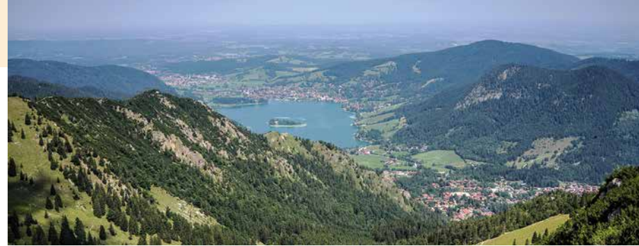
Vor allem die vielen Ausblicke auf Schlier- und Spitzingsee machen die Überschreitung zu einer wunderschönen Runde.