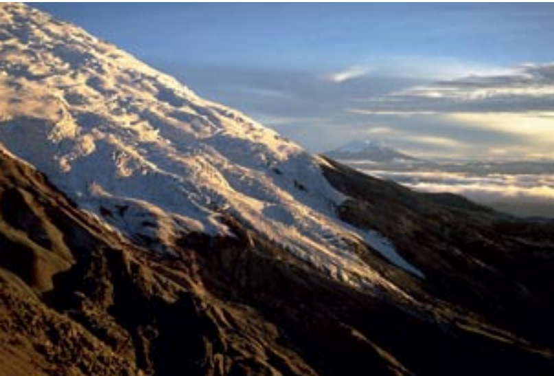
Der Gletschermantel des Cotopaxi im Morgenlicht

Die großen vier Schneeberge überragen deutlich die verbleibenden Fünftausender. Entsprechend weisen sie noch einen imposanten Gletschermantel auf. Eine Besteigung bei gutem Wetter gehört sicherlich zu den eindrucklichsten Bergerlebnissen, die Ecuador zu bieten hat. Da alle Nachbar Gipfel wesentlich kleiner sind, ist die Aussicht einzigartig. Mit einer Drehung um die eigene Achse