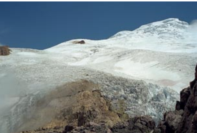
Gletschereinstieg zum Cayambe