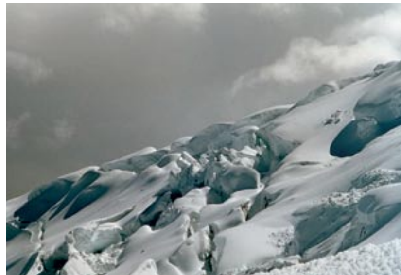
Gletscherabbrüche unter der Äquatorsonne

Von der Terrasse traversiere man leicht nach unten haltend in die linke Talflanke. Nach ca. 100 m wird eine Rippe erreicht, über die waldlos zur unteren, großen Ebene abgestiegen werden kann. Man folge dem Río Blanco auf dessen linker Seite bis ans Ende der großen Ebene. Hier befindet sich bei den Koordinaten (MAP: 828, 650, 0003, 800) eine Hütte. Bei der Hütte überquere man den Bach und begeben sich durch mühsames Kraut einen Kilometer nach W. Hier beginnt eine Acequia, der man mit etwas Mühe folge. Nach einem knappen Kilometer stürzt das Wasser in eine Quebrada und wird erst 50 m weiter unten für die Weiterleitung aufgefasst. Dies ist der Punkt um über die Rippe, die die Quebrada nach rechts begrenzt aufzusteigen. Man steige über die Rippe, bis auf einer Höhe von ca. 3800 m die Quebrada endlich überquert werden kann. Jenseits der Quebrada traversiere man horizontal bis auf eine wei-