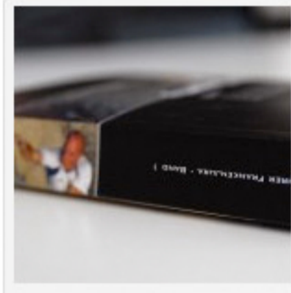
Über 470 Seiten Routeninfos

Bereits die sechste Auflage des Kletterführers "Frankenjura Band 1" liefert Sebastian Schwertner. Die fünfte Auflage war nach 1 1/2 Jahren komplett ausverkauft – das darf als deutliches Indiz für die hohe Qualität und Beliebtheit des Kletterführers gewertet werden. In den sechsten Band wurden sagenhafte 405 Felsen aufgenommen, die genau 4347 Routen beherbergen (ich gebe zu: ich habe es nicht nachgezählt).