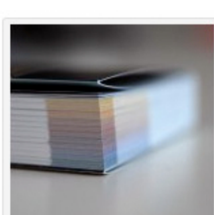
Farbliche Codierung der Regionen