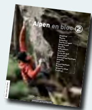
Boulderspaß mit Hüttenromantik.

Für den Überblick im Gebiet sind der AV-Führer Berchtesgadener Alpen vom Bergverlag Rother und die Karte Nationalpark Berchtesgaden (1:25000) des Bayerischen Vermessungsamts sinnvoll.