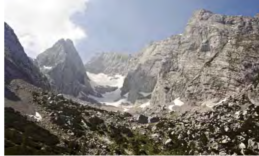
Blockfeld vor Minigletscher.

Er ist der nördlichste Gletscher der Alpen und in Deutschland sowieso der einzige seiner Art, und dass es ihn überhaupt noch gibt, ist erstaunlich genug. Noch trotz der Blaueis tapfer der Klimaerwärmung, aber schon jetzt ist der verbliebene Rest bereits weniger als das, was allein im letzten Jahrzehnt dahin geschmolzen ist. Wer schon immer mal vor voll hochalpinem Hintergrund bouldern wollte, muss sich also rucki-zucki ran halten. Und das schon beim Zugang, denn der Aufstieg ins ewige bayerische Eis zieht sich ganz gehörig. Da wird sich mancher Sportsfreund zwischendurch gern mal auf seine Matratze legen.