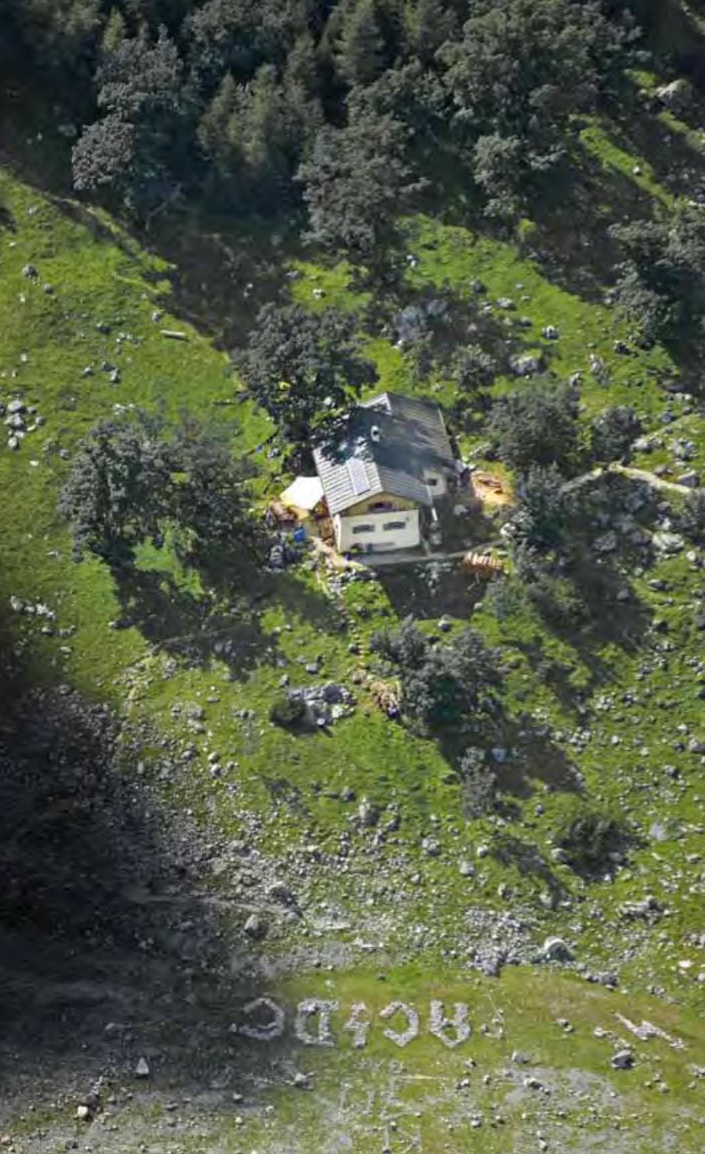
Wenn die Highway to hell hier endet, solls recht sein.