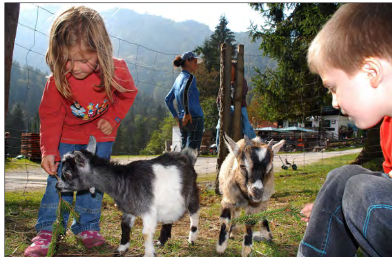
Streichleinheiten können im Gehege verteilt werden.