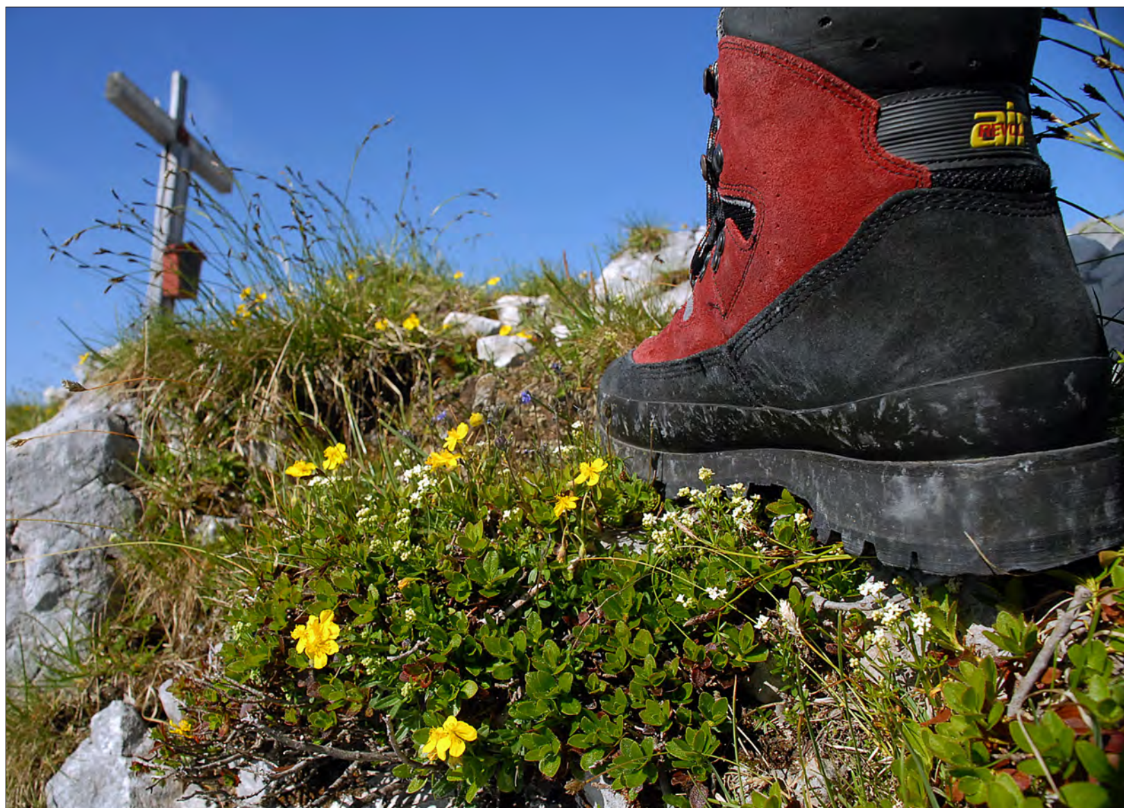
Graspolster und Blütenpracht: Der Gipfel des nur schwer zugänglichen Großen Grundübelhorns überrascht mit einem kleinen Plateau, auf dem man genügend Platz findet für eine entspannte Rast. Für die Tour sollte man insgesamt fünf bis sechseinhalb Stunden Gehzeit einplanen.

Via Totenstein und Barthrinne auf das Große Grundübelhorn: Kleines Gipfelidyll über der Felswildnis