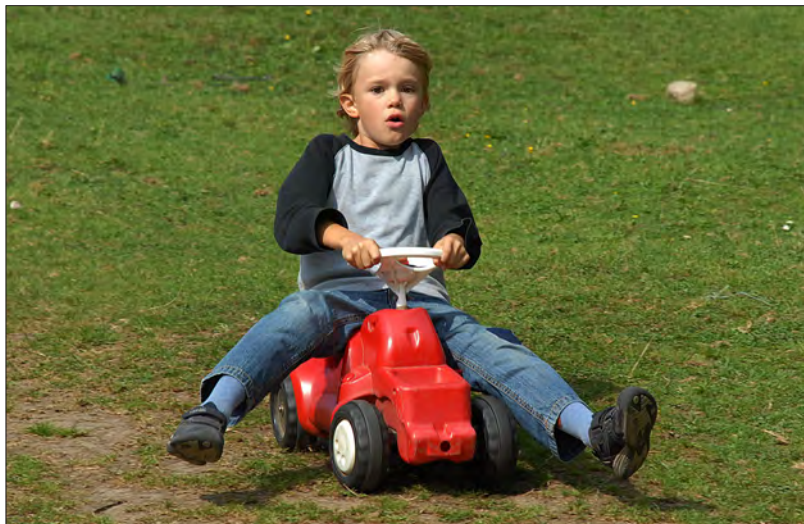
Rasant geht es auf der hauseigenen Bobby Car-Piste bergab.

Über die Gießenbachklamm ins Kinderparadies: Familienwanderung zur Schopperalm – Wenig Gehzeit, viel Spielzeit