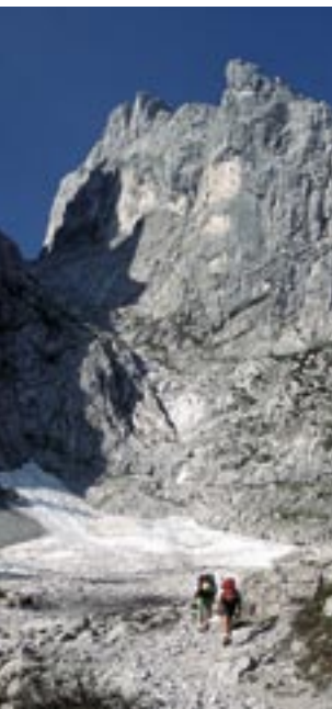
Die Steinernen Rinne, rechts die Fleischbank Ostwand