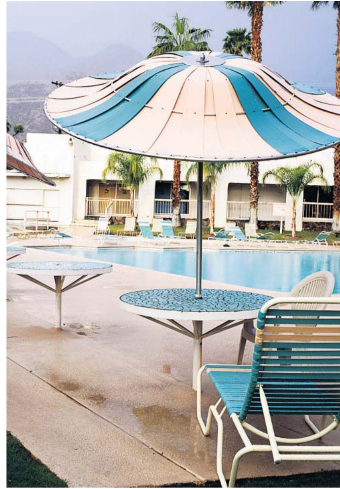
Im „Orbit In“ ist die Zeit an einem Punkt stehengeblieben, als alle Formen von der Zukunft erzählt. Es ist, als babe die heiße Luft hier alles konserviert – Palm Springs hat im Jahr 350 Tage Sonne und kaum Regen.